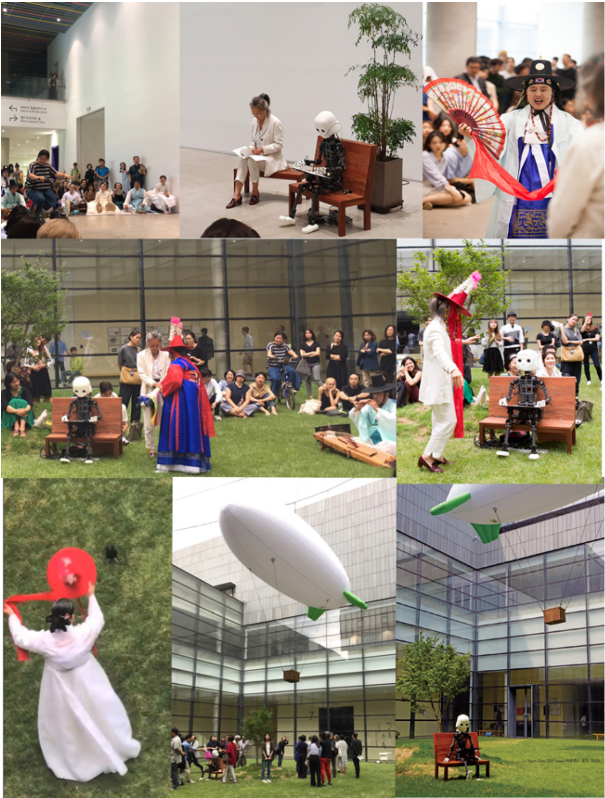
김순기, <시간과 공간 2019>, 2019, 국립현대미술관 퍼포먼스 및 설치 모습