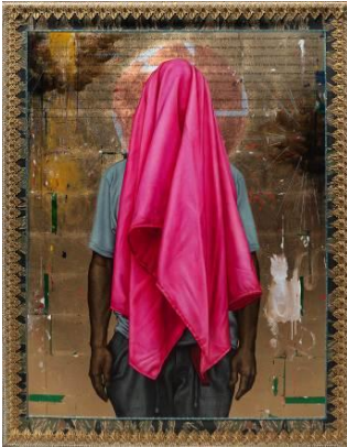
Shrouded II 2026 Oil, acrylic, trimmings, fabric, metallic leaf on canvas 153 x 118.5 cm

Another featured work, Shrouded (2026) series depicts human figures covered in multi-colored cloths, focusing on the tension between revelation and concealment. The ornate trimming and metallic leaf overlap with the materiality of oil, acrylic, and actual fabric, revealing the complex layers of the self. While these decorative elements reproduce the splendor of Catholic iconography, they also symbolize the psychological veils that individuals wrap around themselves for protection within grand systems.