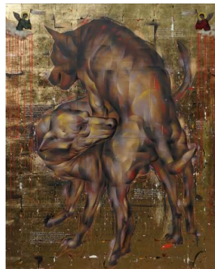
There Is Not Enough Pain and Pleasure in the World to Permit Giving Any of It Away to the Greed of Mankind 2022 Oil, acrylic, spray paint, paper, decal, metallic leaf on paper 228 x 186 cm

There Is Not Enough Pain and Pleasure in the World to Permit Giving Any of It Away to the Greed of Mankind (2023) explores the delicate boundary between the sacred and the profane, contrasting a shimmering metallic leaf background with the forms of beasts. By utilizing the ornate decorative qualities of illuminated manuscripts—traditionally found in Western religious painting—and the dramatic intensity of chiaroscuro, Leslie de CHAVEZ creates a powerful sense of heterogeneity.