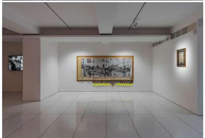
Installation view of Leslie de CHAVEZ: Thy Will Be Done at ARARIO GALLERY SEOUL, Seoul, Korea, 2026.