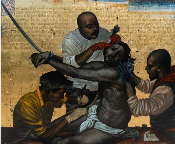
Siesta no.1: The Sessions (Or How to Unsolve a Chronic Cultural Dilemma Without the Usual Means or Processes)