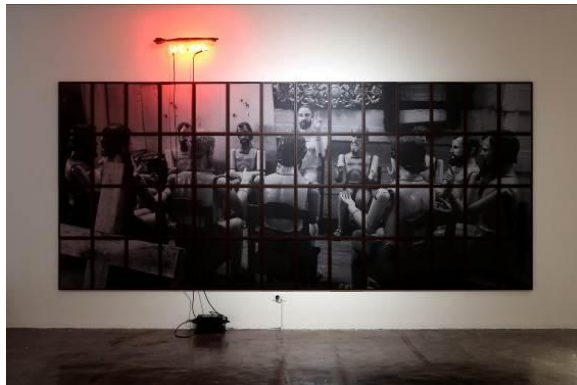
The OGs as Christian Virgins Exposed to the Populace (After F.R.Hidalgo)