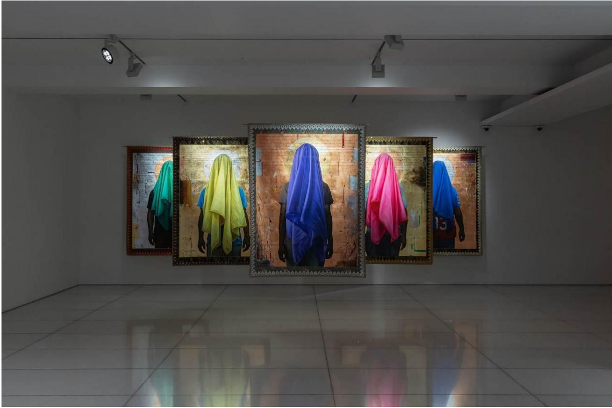
레슬리 드 차베즈, 《뜻이 이루어지소서》(아라리오갤러리 서울, 2026) 전시전경.

참여작가 : 레슬리 드 차베즈(b. 1978) 전시제목 : 《뜻이 이루어지소서》 전시일정 : 2026년 5월 1일(금) – 6월 20일(토) 전시장소 : 아라리오갤러리 서울(종로구 을곡로 85) 3F, 4F 전시작품 : 회화 8점, 영상 2점, 설치 5점