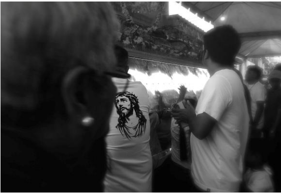
<복되도다> 2026 단채널 영상 5'00"

3층 전시장에 선보이는 영상 작품 <복되도다>(2026)[별첨1]는 필리핀어로 낭독되는 작가의 시와 영문 자막, 그리고 필리핀 성금요일(Good Friday)의 축제 행렬 풍경을 보여주는 작업이다. 성금요일은 부활절 직전의 금요일로, 예수가 십자가에 못 박혀 고난을 당하고 죽음을 맞이한 날을 기리는 날이다. 화면은 등에 예수의 형상이 그려진 한 남자의 뒤를 따라가며, 4월의 붉은 무더위가 내려앉은 필리핀의 거대한 복판을 천천히 비춘다. 레슬리 드 차베즈는 성스러운 기도와 세속적인 일상의 소품들이 뒤섞인 이 풍경을 통해, 필리핀 사회를 지탱하는 신앙의 양면성을 가감 없이 드러내고 있다.