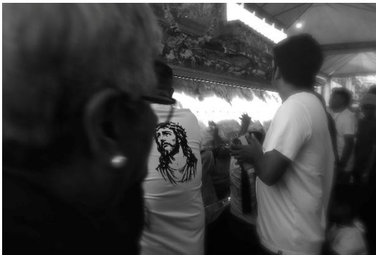
Blessed Art Thou

Presented on the third floor, the video work Blessed Art Thou (2026) features the artist's poetry recited in Filipino with English subtitles, juxtaposed against scenes from a Good Friday procession in the Philippines. Good Friday is the Friday preceding Easter, commemorating the crucifixion and death of Jesus Christ. The camera follows a man with an image of Christ depicted on his back, slowly capturing the heart of a Philippine street settled under the crimson swelter of April. Through this landscape, where sacred prayers and contemporary secular objects are intertwined, Leslie de CHAVEZ candidly reveals the dual nature of faith that sustains Philippine society.