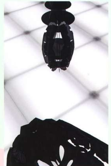
©《FINAL CUT 파이널컷》 설치 전경, 아라리오갤러리 서울, 2020