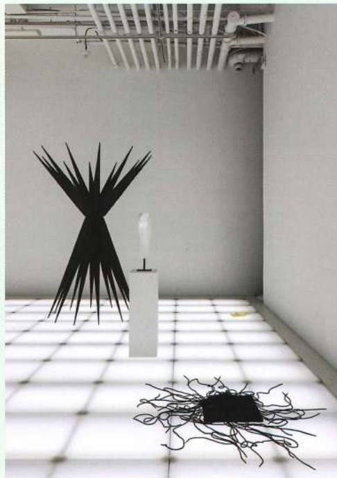
©《FINAL CUT 파이널컷》 설치 전경, 아라리오갤러리 서울, 2020