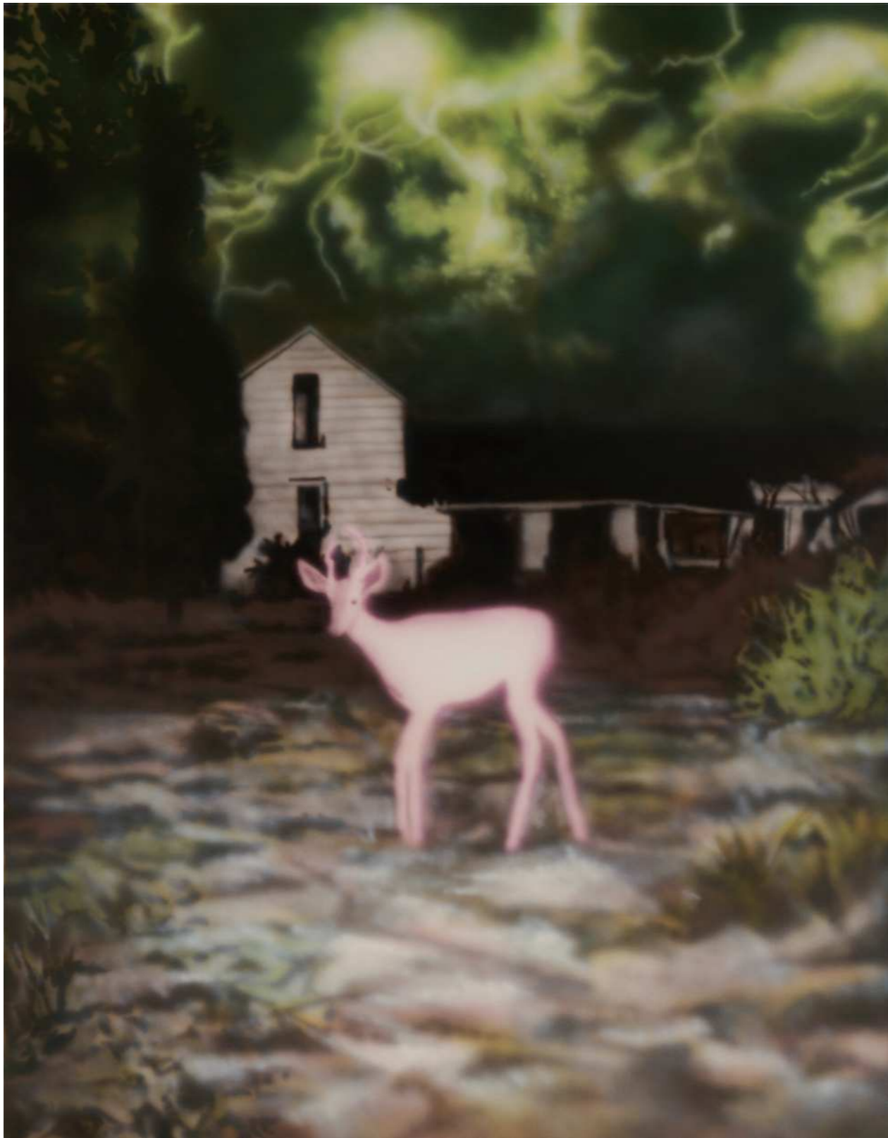
HOLY 홀리 2024 Acrylic on canvas 116.8 x 91 cm