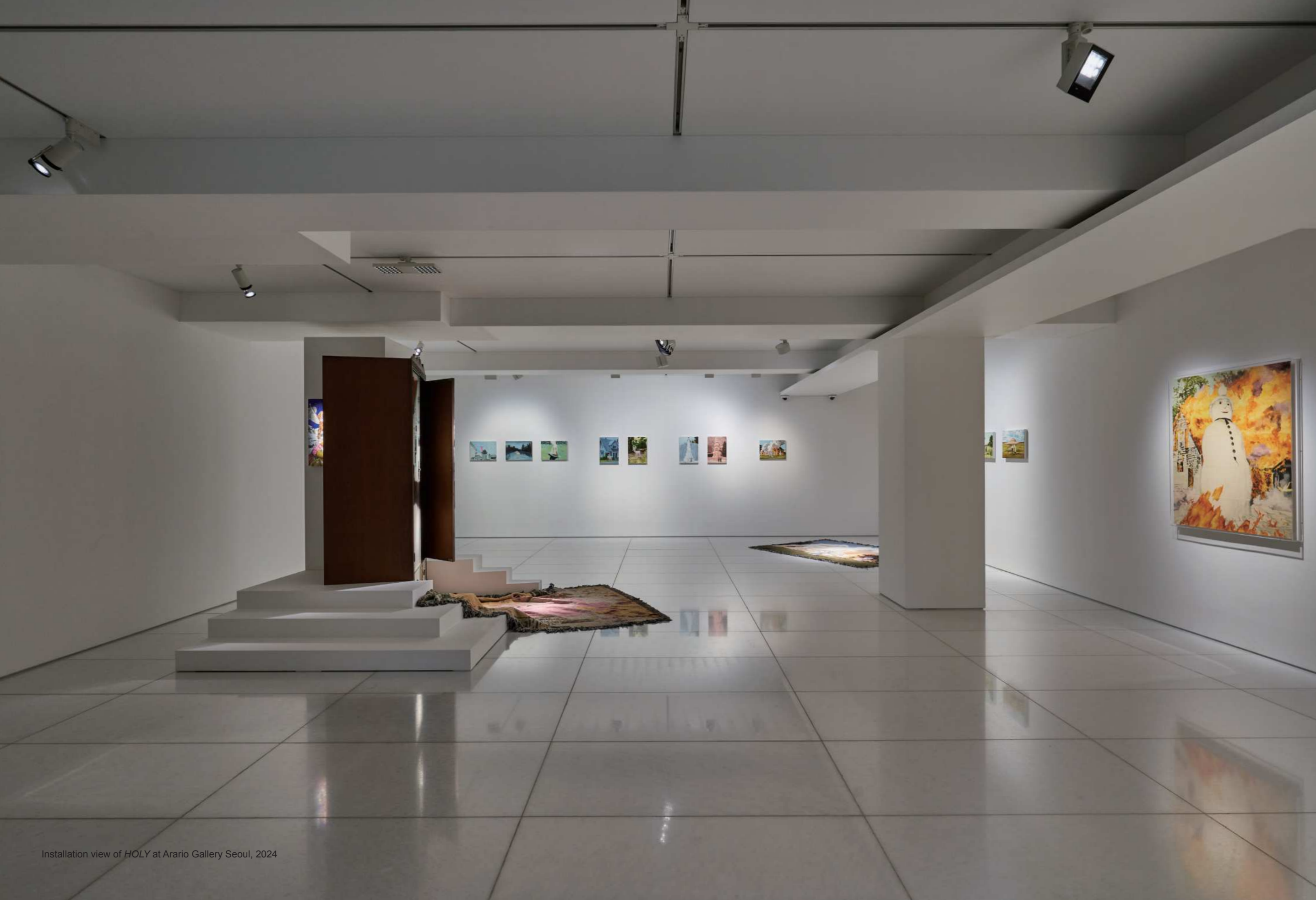
Installation view of HOLY at Arario Gallery Seoul, 2024