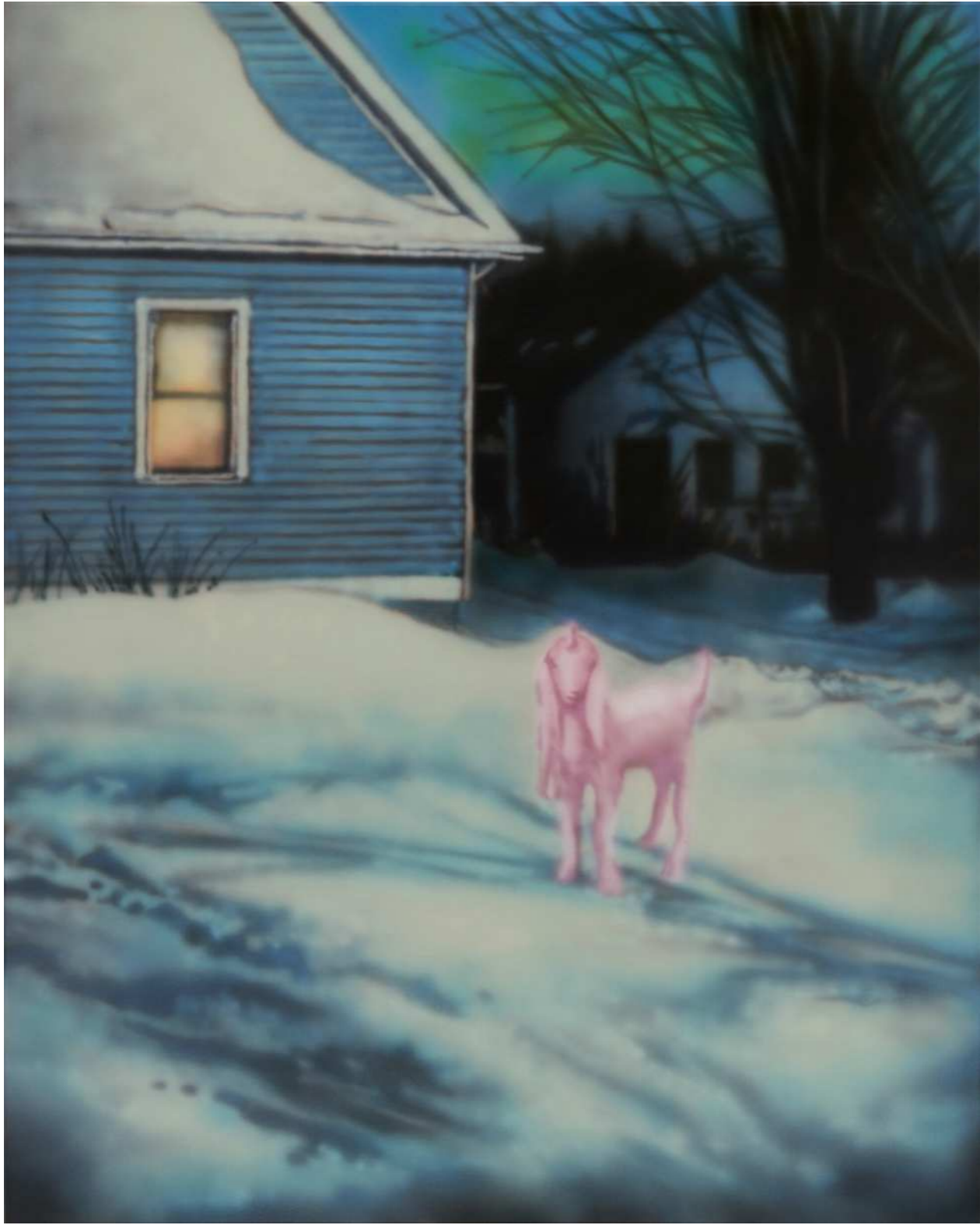
HOLY 홀리 2024 Acrylic on canvas 90.9 x 72.7 cm