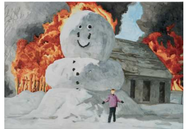
HOLY 홀리 2024 Oil on canvas 29.7 x 42 cm (each)