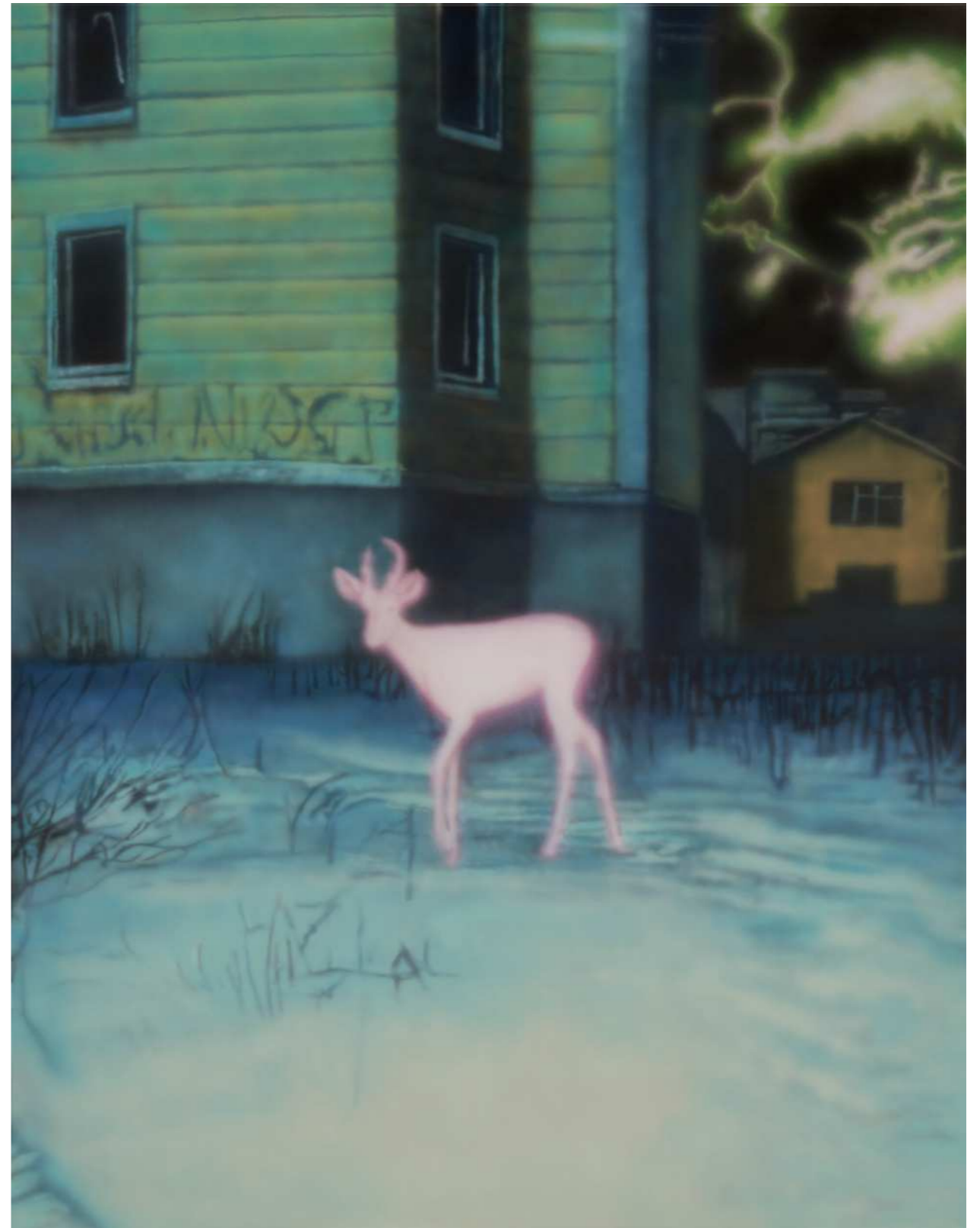
HOLY 홀리 2024 Acrylic on canvas 116.8 x 91 cm