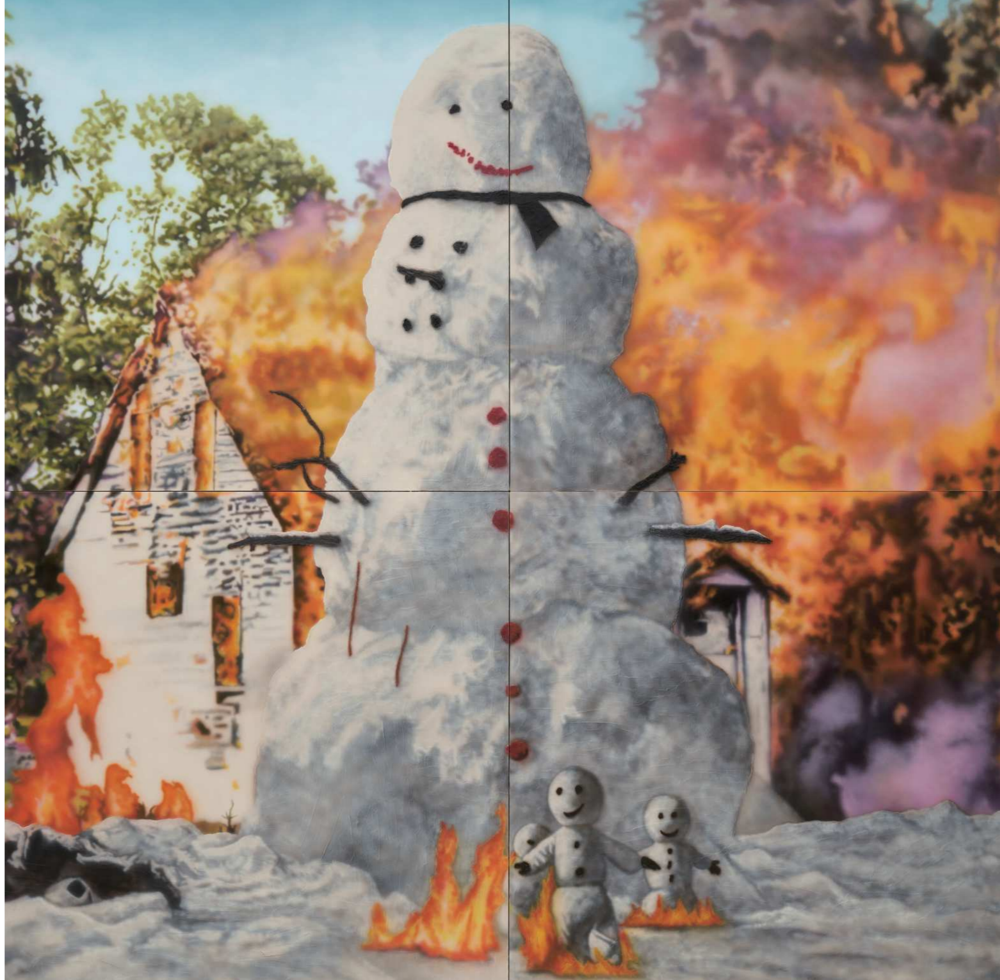
HOLY 홀리 2024 Acrylic on canvas 300 x 300 cm (150 x 150 cm x 4)