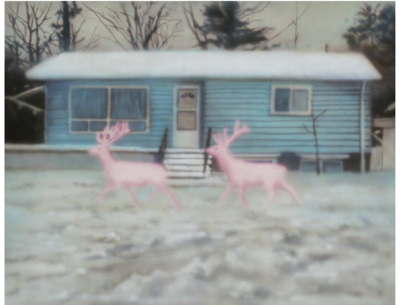
HOLY 홀리 2024 Acrylic on canvas 91 x 116.8 cm