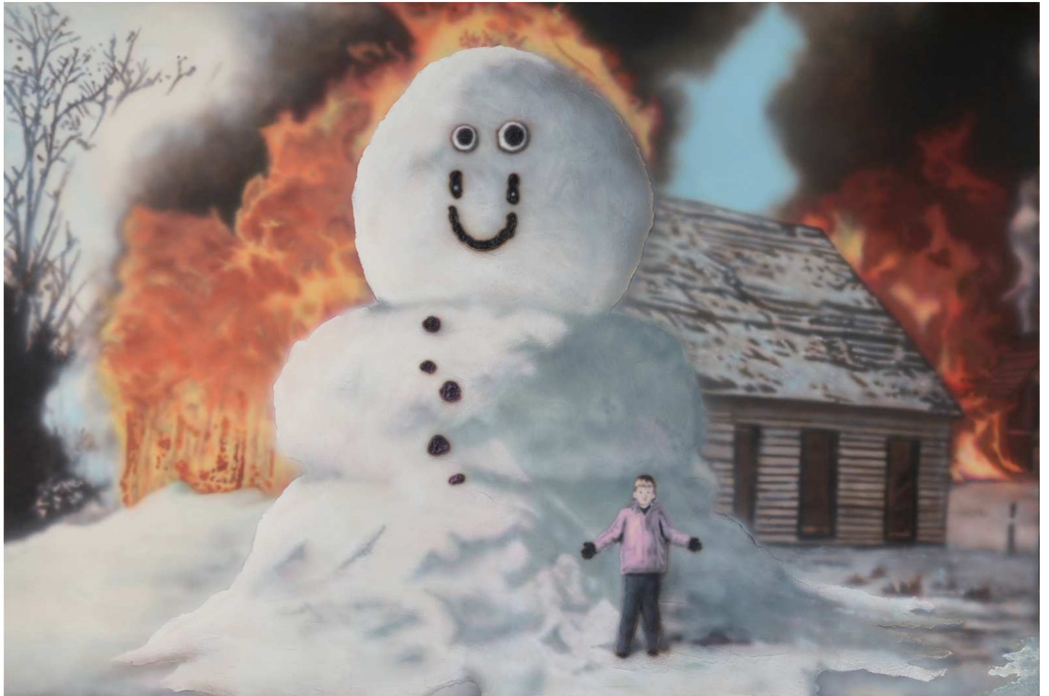
HOLY 홀리 2023 Acrylic on canvas 130.3 x 193.3 cm