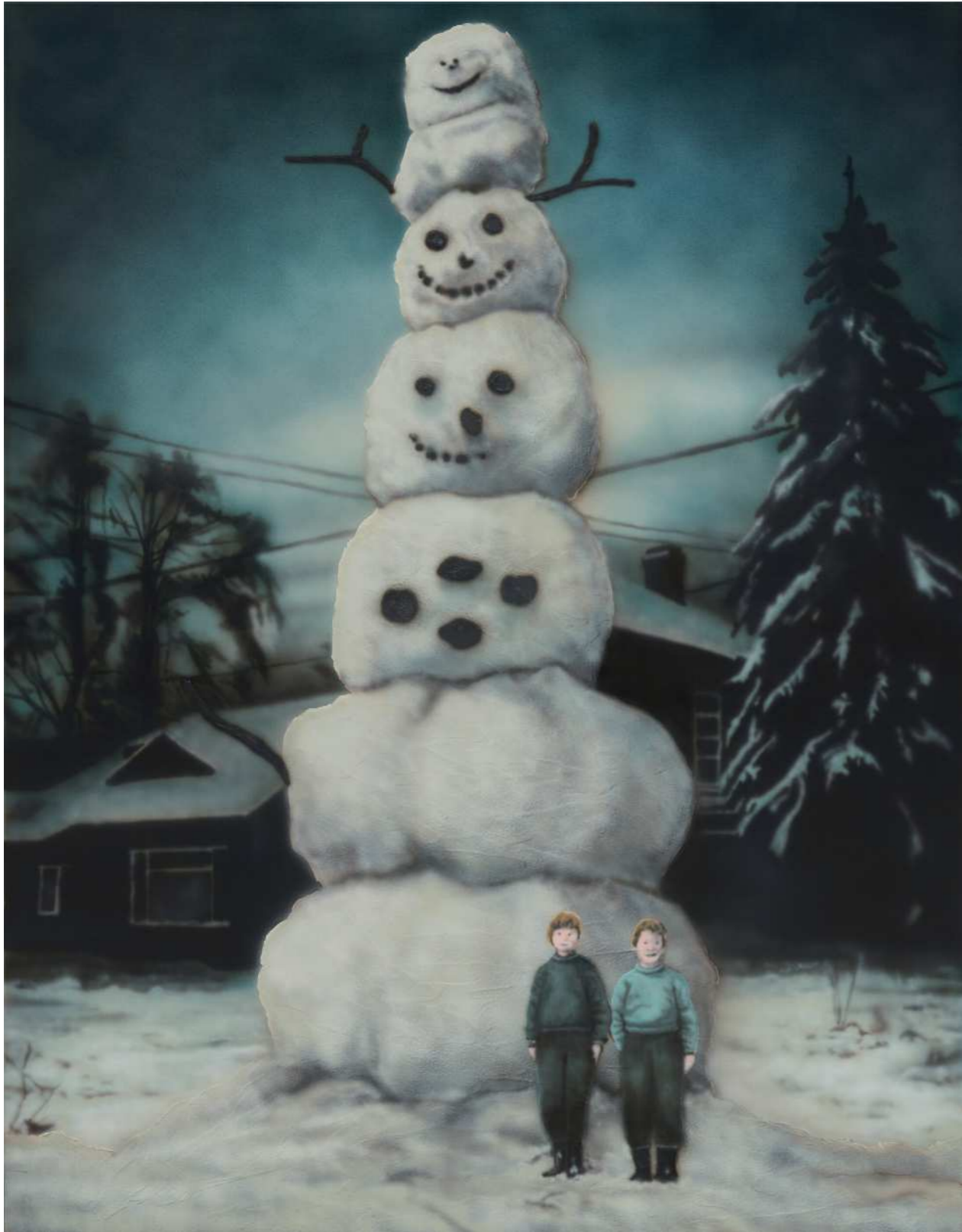
HOLY 홀리 2024 Acrylic on canvas 116.8 x 91 cm