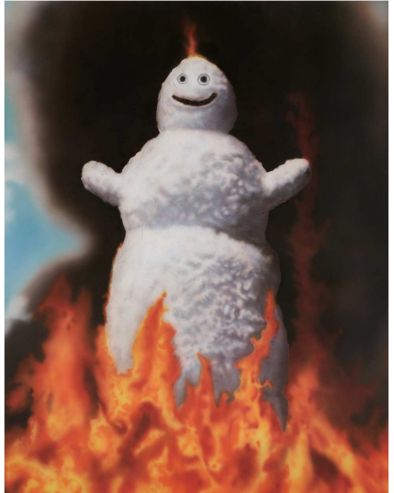
HOLY 홀리 2024 Acrylic on canvas 116.8 x 91 cm