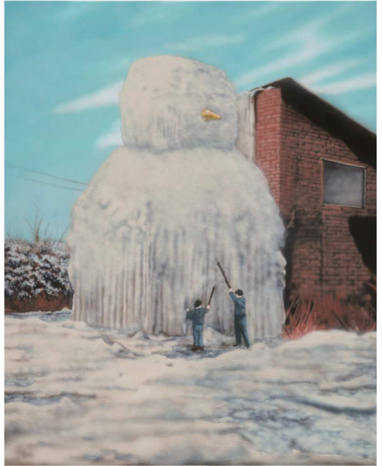
HOLY 홀리 2024 Acrylic on canvas 90.9 x 72.7 cm