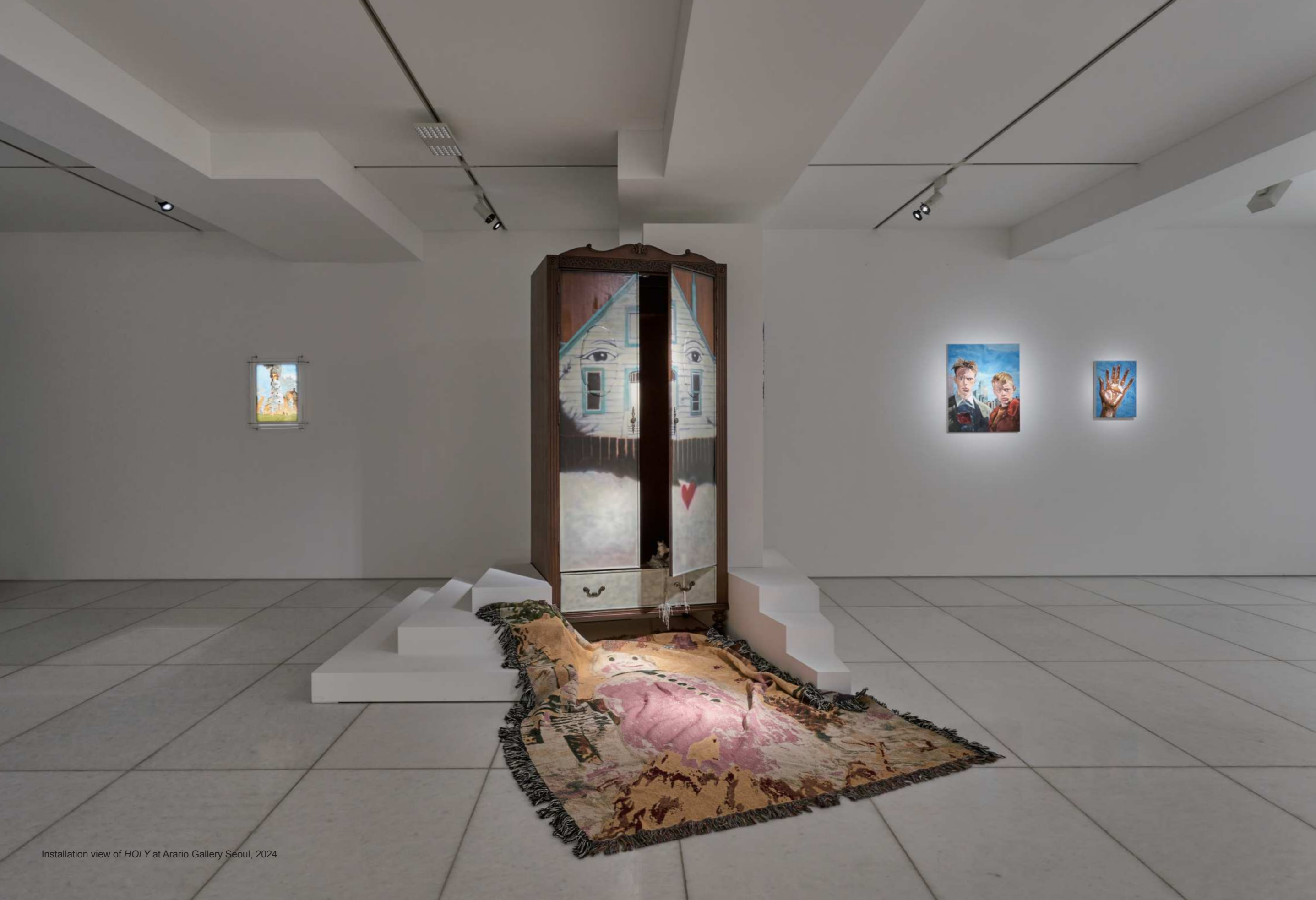
Installation view of HOLY at Arario Gallery Seoul, 2024