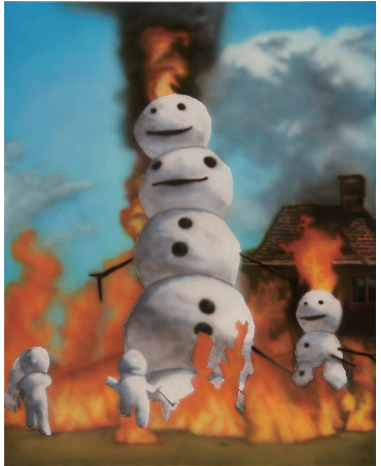
HOLY 홀리 2024 Acrylic on canvas 90.9 x 72.7 cm