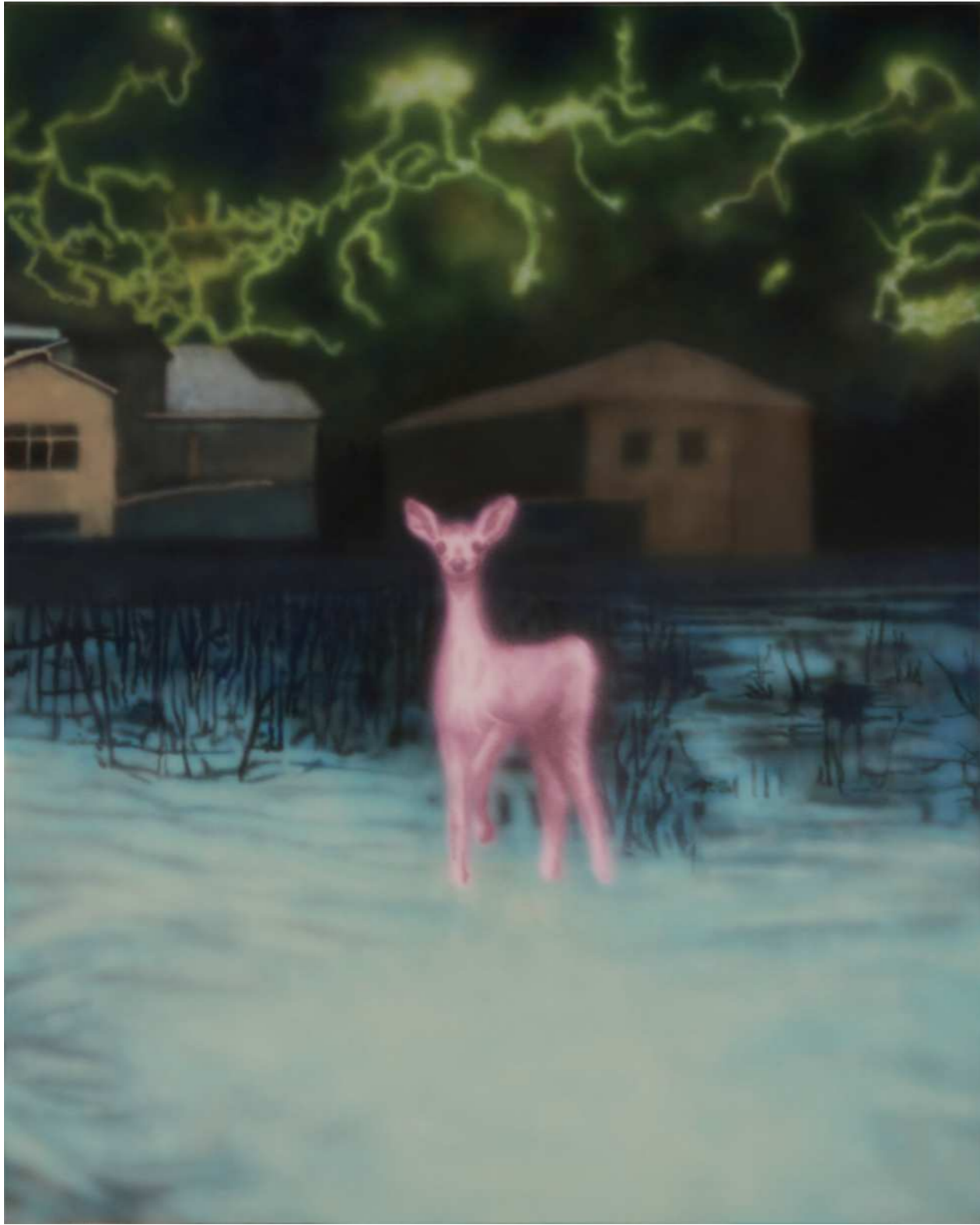
HOLY 홀리 2024 Acrylic on canvas 90.9 x 72.7 cm