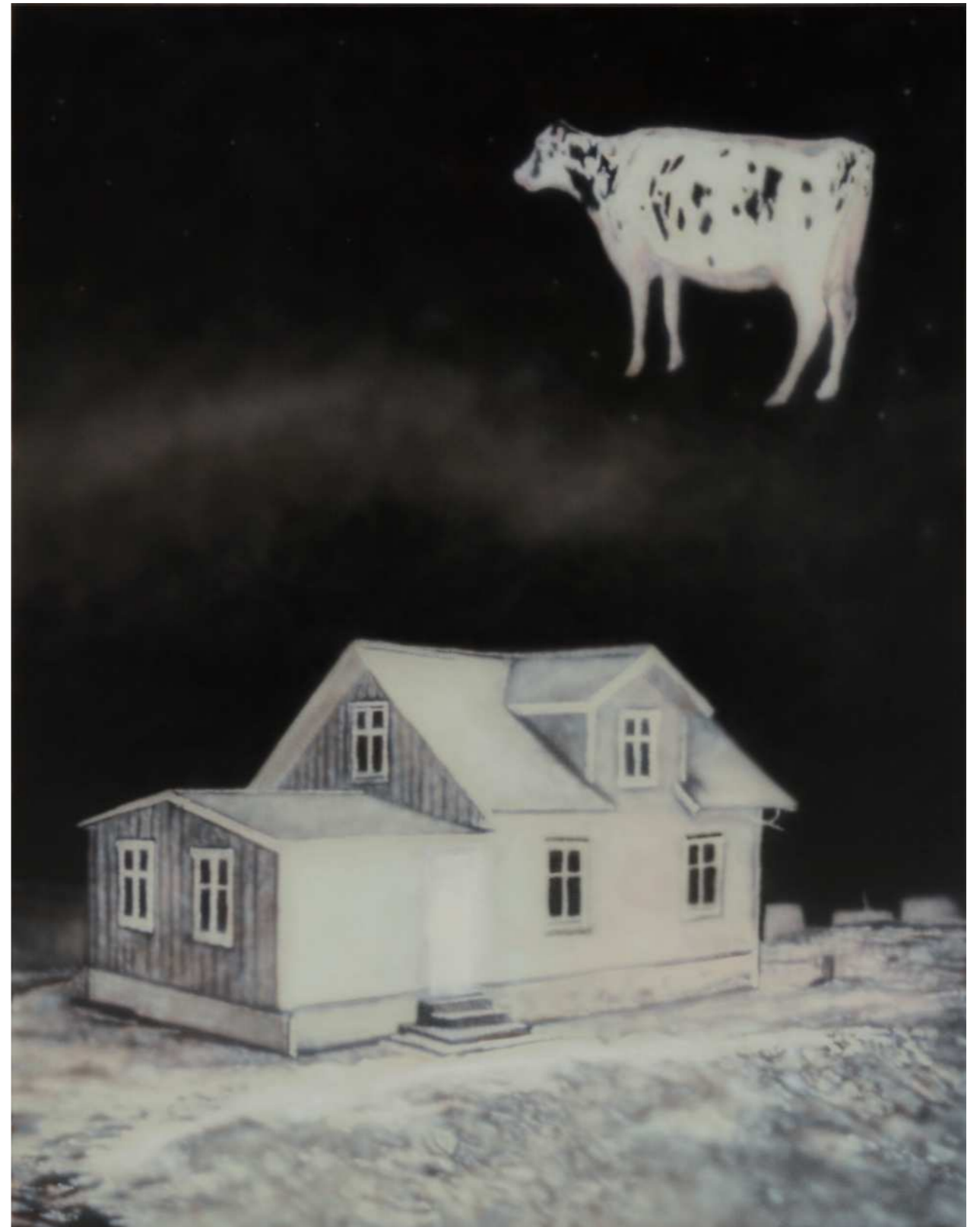
HOLY 홀리 2024 Acrylic on canvas 116.8 x 91 cm