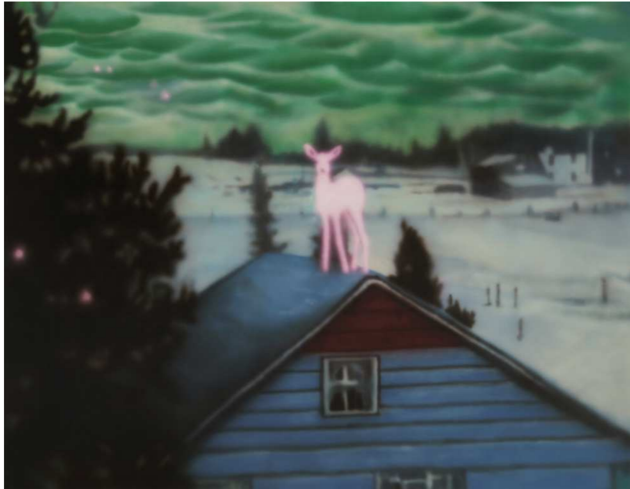
HOLY 홀리 2024 Acrylic on canvas 91 x 116.8 cm