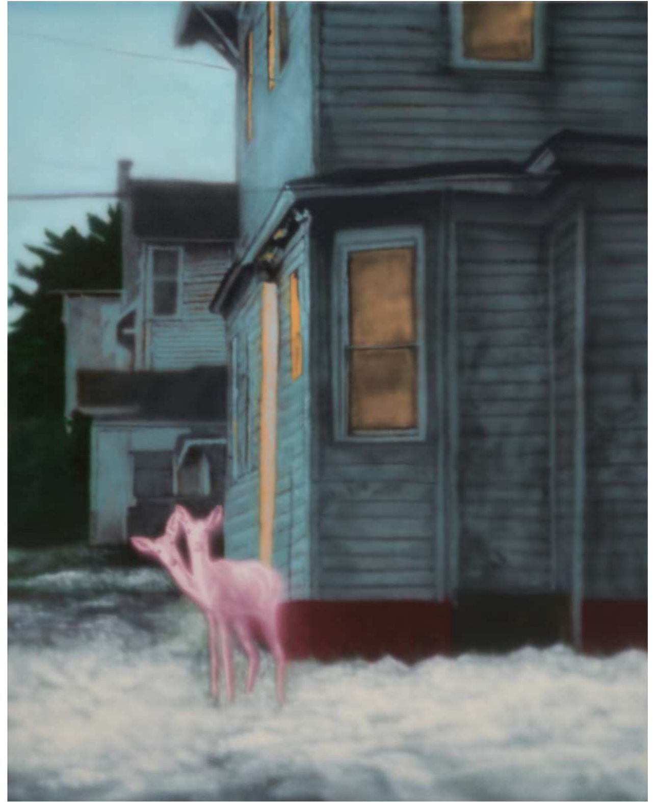
HOLY 홀리 2024 Acrylic on canvas 90.9 x 72.7 cm