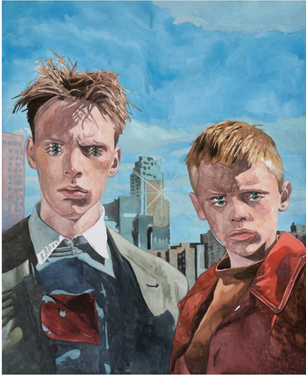
HOLY 홀리 2024 Watercolor on canvas 65.1 x 53 cm