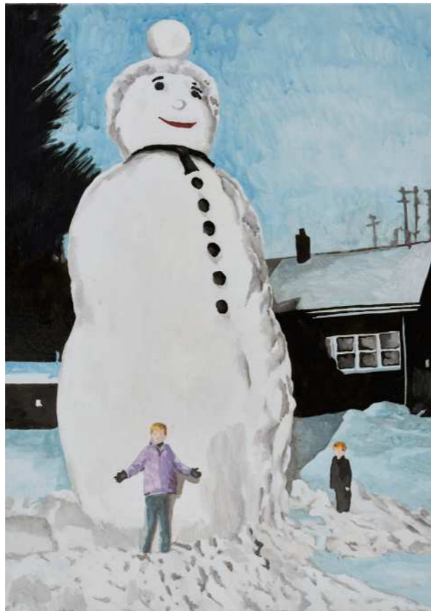
(Left) HOLY 홀리 2024 Oil on canvas 42 x 29.7 cm (each)