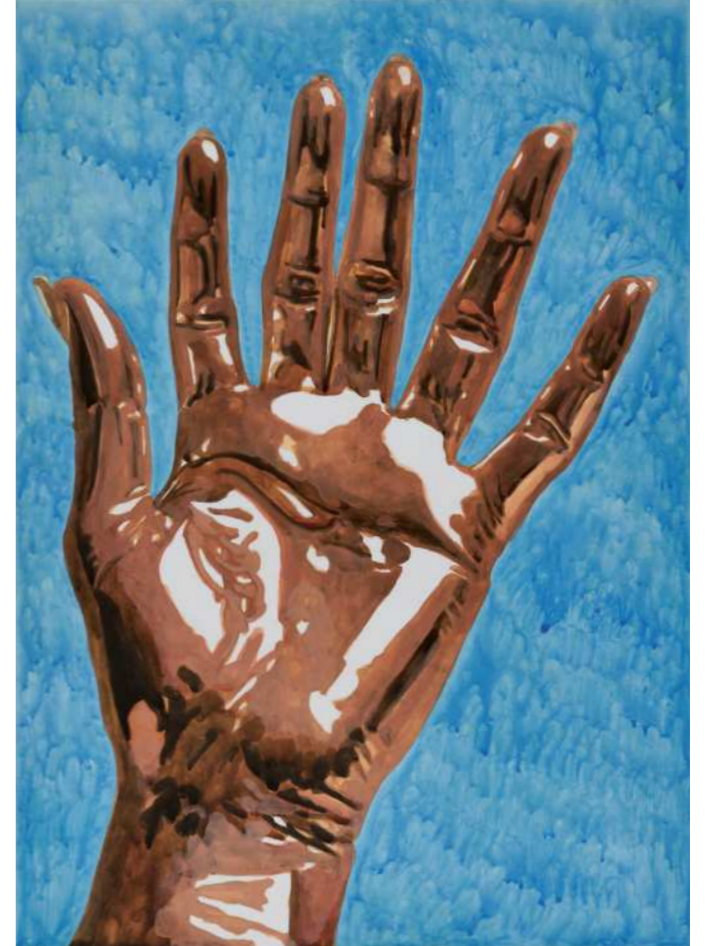
HOLY 홀리 2024 Oil on canvas 42 x 29.7 cm