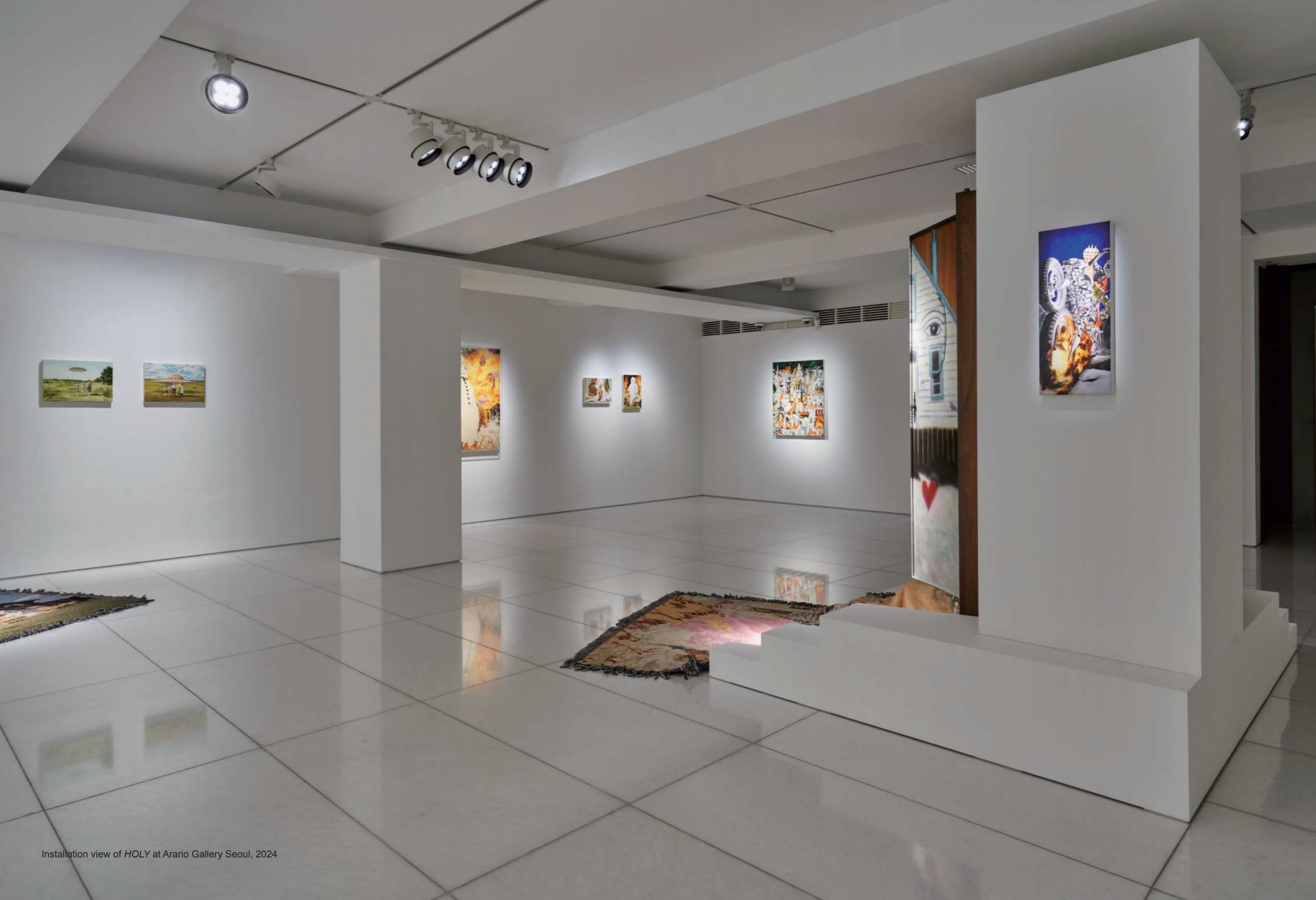
Installation view of HOLY at Arario Gallery Seoul, 2024